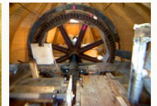
Kamrad und Flügelwelle in der Kappe