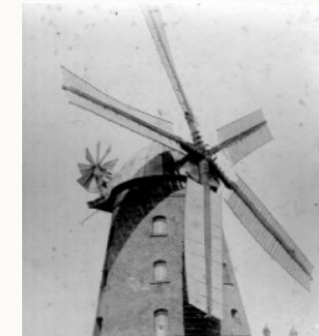
Aufnahme der Mühle um 1892

Die wohl bis jetzt größte Sanierung erlebt die Mühle in den Jahren 2014/2015. Für über 420.000,00 € wird die Mühle dank des Bundes, des Landes Niedersachsen, der Deutschen Stiftung Denkmalschutz, Bingo-Umweltstiftung, Stiftung Braunschweigischer Kulturbesitz, Stiftung Braunschweiger Land, der Gemeinde Lehre und des Mühlenfördervereins denkmalgerecht restauriert. Der Wall wird bis zum Sockel ausgegraben und das freigelegte Mauerwerk gegen Feuchtigkeit geschützt, die Außenhaut und viele im Inneren der Mühle befindliche Balken/Balkenköpfe werden saniert.