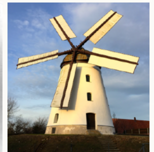
Mühle nach der Restauration im Jahr 2016