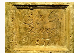
Grundstein der Mühle mit Inschrift