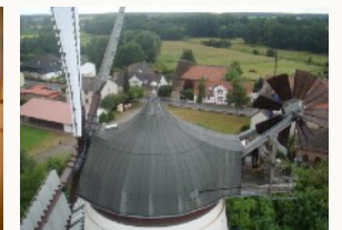
Draufsicht auf die Mühle von oben